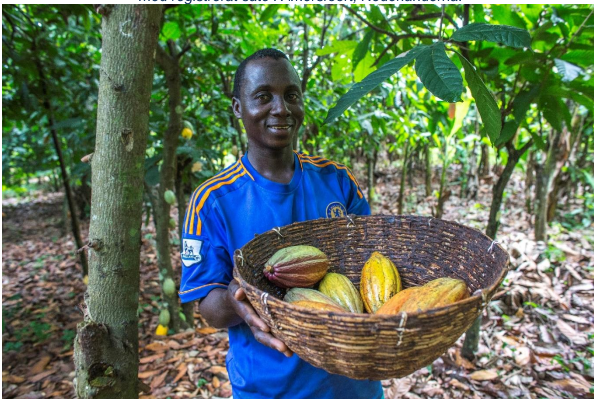
Foto från en kaffeodling från Oikocredits partner Ecookim, ett kaffekooperativ i Elfenbenskusten

Stiftat i Nederländerna som ett kooperativt sällskap med undantaget ansvar med registrerat säte i Amersfoort, Nederländerna.